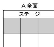
スポーツ吹矢 バレーボール ラージ卓球(水) フットサル