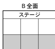
ファイト 2 よさこいソーラン バドミントン ショートテニス