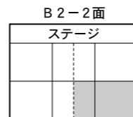
B2-2面 ステージ スポチャン

☆火曜日のラージ卓球は12:00~14:00です。 *空手は平井中学校武道場で行います。