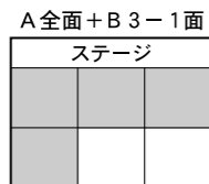
A全面+B3-1面 ステージ ラージ卓球(火、金) 卓球